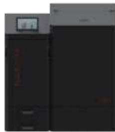
380 L silo xx0000220

Ydelses data er forventede - vi er pt. i færd med afslutning af test på Dansk Teknologisk Institut