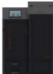
280 L silo xx0000120